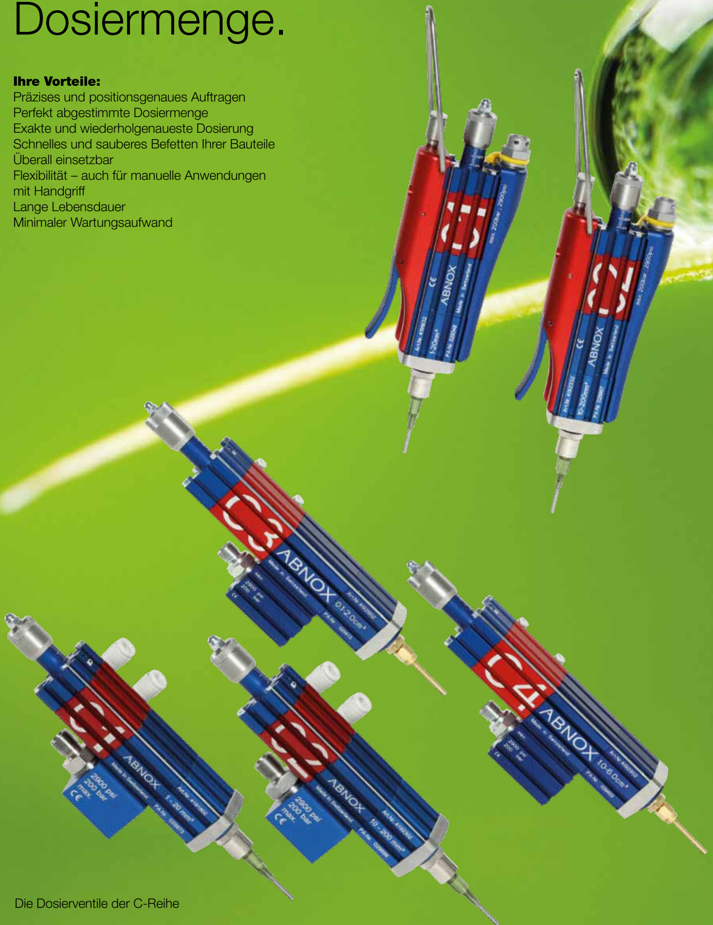
Die Dosierventile der C-Reihe

Präzises und positionsgenaues Auftragen Perfekt abgestimmte Dosiermenge Exakte und wiederholgenaueste Dosierung Schnelles und sauberes Befetten Ihrer Bauteile Überall einsetzbar Flexibilität – auch für manuelle Anwendungen mit Handgriff Lange Lebensdauer Minimaler Wartungsaufwand