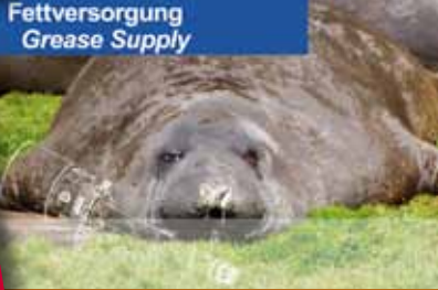
Fettversorgung Grease Supply

Druckluft und Elektro-Fettversorgungssysteme und Pumpen zum Fördern von mittel- bis hochviskosen Schmierstoffen