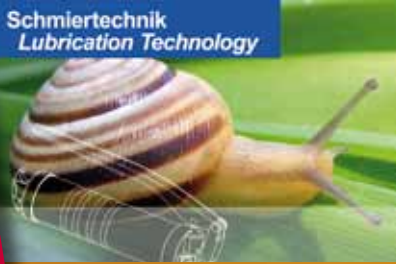
Schmiertechnik Lubrication Technology

Hand-, elektrisch und pneumatisch betätigte Abschmier- und Abfüllgeräte zum Fördern von Fetten und Ölen