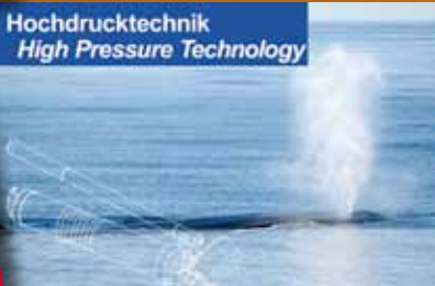
Hochdrucktechnik High Pressure Technology

Hochdruck Einhand- und Handhebelpressen, Hochdruckventile, pneumatische und elektrische Hochdruckpumpen, Spannsysteme