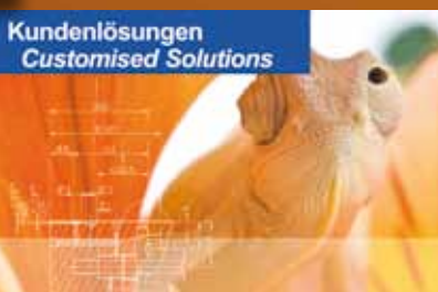
Kundenlösungen Customised Solutions

Fordern Sie unsere aktuellen Informationen an oder besuchen Sie unsere Website: www.abnox.com