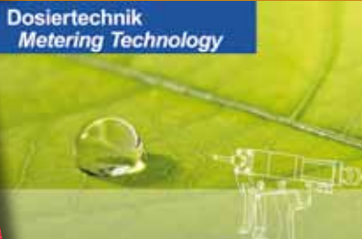
Dosiertechnik Metering Technology

Dosierventile, Steuerungselemente, werkstückspezifische Applikationen