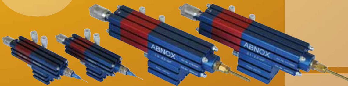
Die Dosierventile der C-Reihe